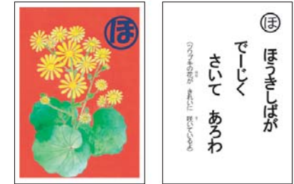
【八丈・島ことばかるた】

見本となる「八丈・島ことばかるた」や奄美方言による「ことわざかるた」、オリジナル「かるた」作りのためのダウンロード用データ等で構成。「方言かるた」を通して、子ども達が方言に対する認識を深め、自分の地域や方言に誇りを持つとともに、共通語との違いを学ぶことができます。